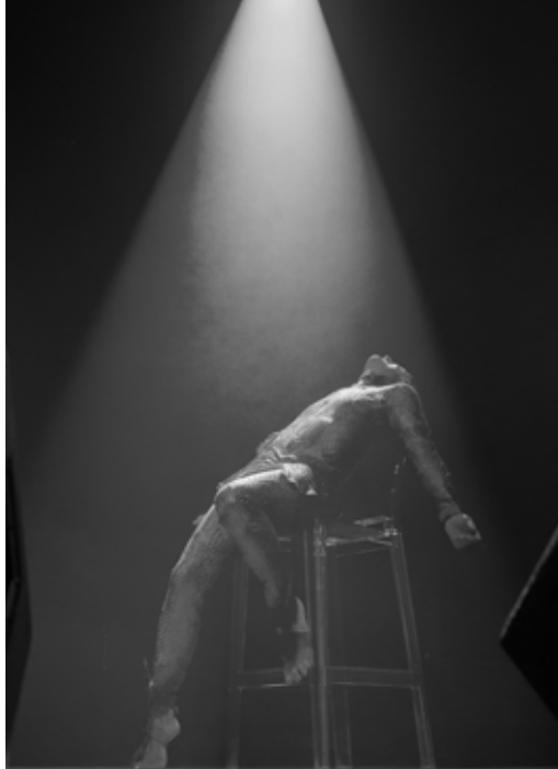
Tour Bloco na Rua.