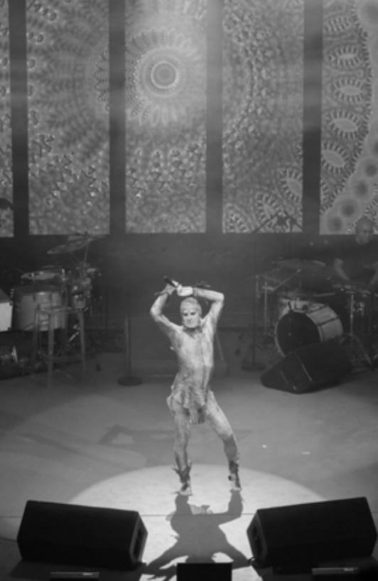
Tour Bloco na Rua.

donou as maquiagens, vestiu um terno e atraiu um novo público. Porém, em 1989, voltou a se apresentar com fantasia; o repertório trouxe regravações de antigos sucessos, entre outras músicas que nunca havia gravado, como “Comida” (do repertório do grupo Titãs) e “O Beco” (gravada originalmente pelo grupo Os Paralamas do Sucesso), além da regravação de “Morena de Angola” (Chico Buarque), sucesso na voz de Clara Nunes.