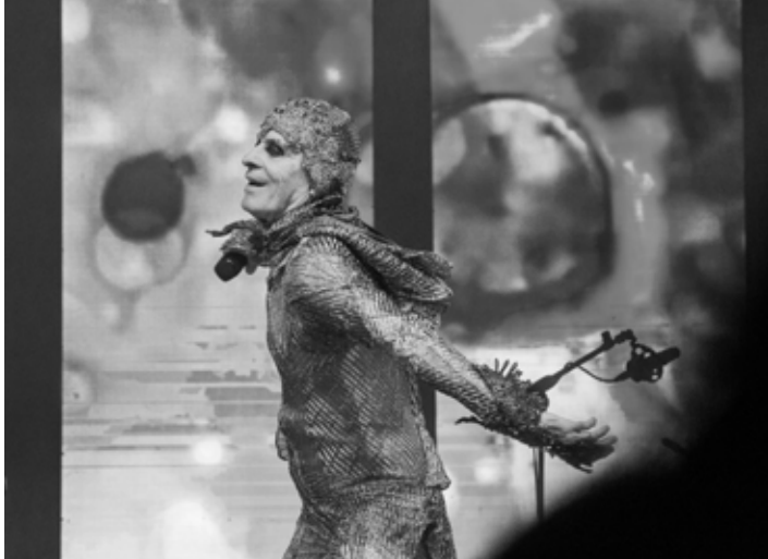
Tour Bloco na Rua.

Começou a década de 1980 com o álbum Sujeito Estranho , produzido por Gutti Carvalho, cujo repertório é todo composto por canções apresentadas no espetáculo Seu Tipo , mas que não haviam sido gravadas no álbum homônimo.